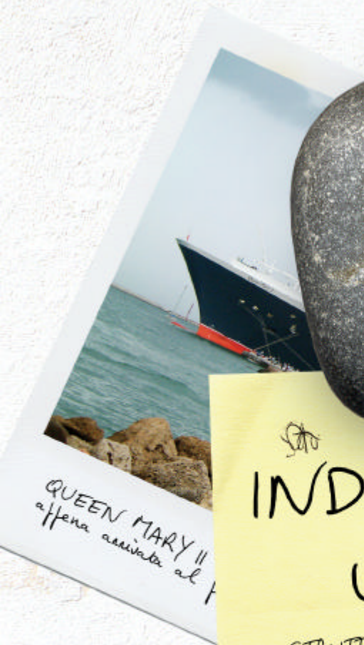
QUEEN MARY II appena arrivata al